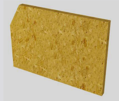
Außenwand F30 Brandschutz

In der Broschüre „Systemaufbauten für Neubau und Sanierung“ haben wir viele weitere Aufbauten für Innen- und Außenwände, auch Beispiele für erhöhte Schallschutzanforderungen, für Sie dargestellt. Diese Broschüre steht im Downloadbereich als Blätterkatalog und als PDF zur Verfügung.