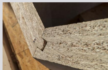
Verbindungsdetails von schlanken Elementen aus SWISS KRONO MAGNUMBOARD® OSB